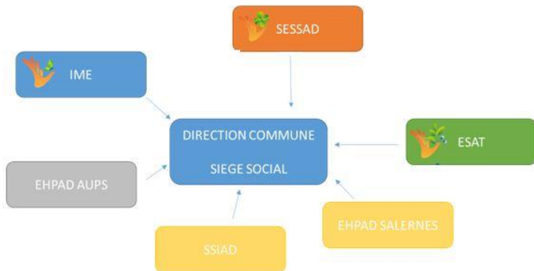
Organigramme général Établissements publics du Haut-var

Il s'agira de proposer une continuité d'accompagnement tant social que professionnel visant à prévenir les situations de rupture.